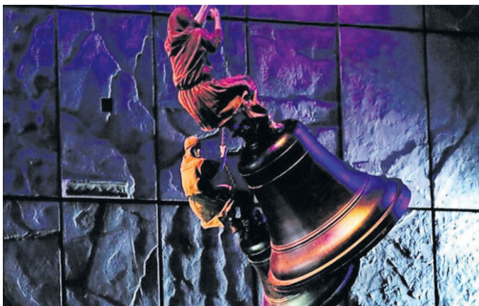
Una scena dal musical "Notre Dame de Paris"

Il musical dei numeri record firmato da Riccardo Cocciante oggi, domani e mercoledì a Cagliari