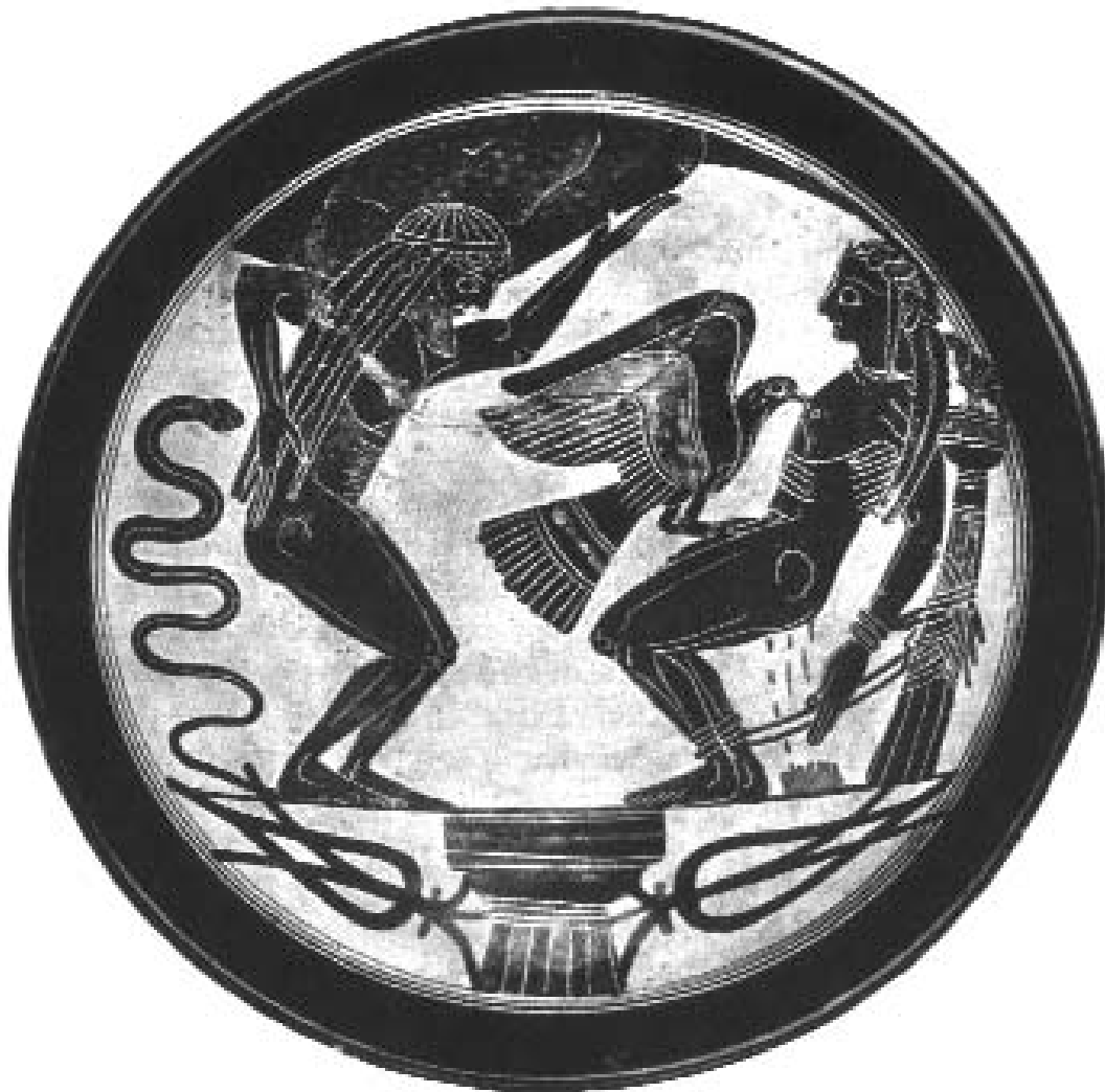
Atlante e Prometeo, a segnare i confini del mondo greco arcaico. Coppa laconica, Roma, Museo Etrusco Vaticano